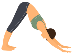
ADHO MUKHA SVANASANA